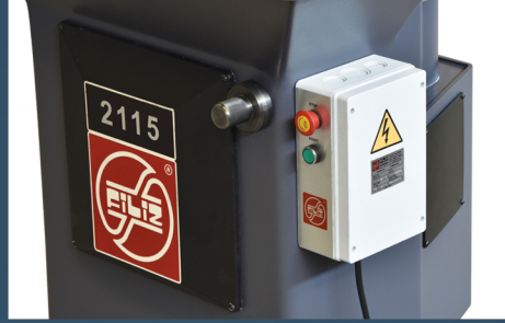
Ayar ve ana kumandalar Adjustment and main controls