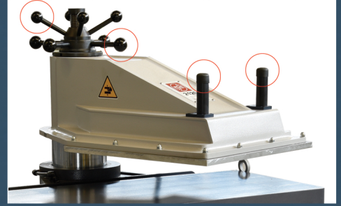
Kontrol butonları ve yükseklik ayarı Control buttons and height adjustment